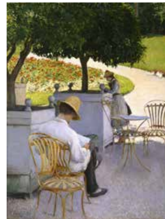
Die Orangenbäume Gustave Caillebotte, 1878