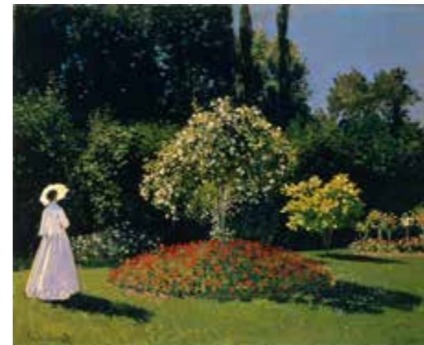
Frau im Garten Claude Monet, 1867

Neben der allgemeinen Entwicklung des bürgerlichen Gartens war Gartenenthusiast Monet der Wegbereiter für den Siegeszug der Gärten in der Kunst. Und viele Künstler der nächsten Generationen folgten seinem Beispiel: Gustav Klimt, Max Liebermann, Paul Klee, Emil Nolde, Henri Matisse, um nur einige zu nennen.