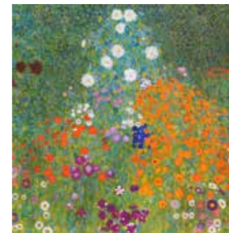
Bauerngarten Gustav Klimt, 1907