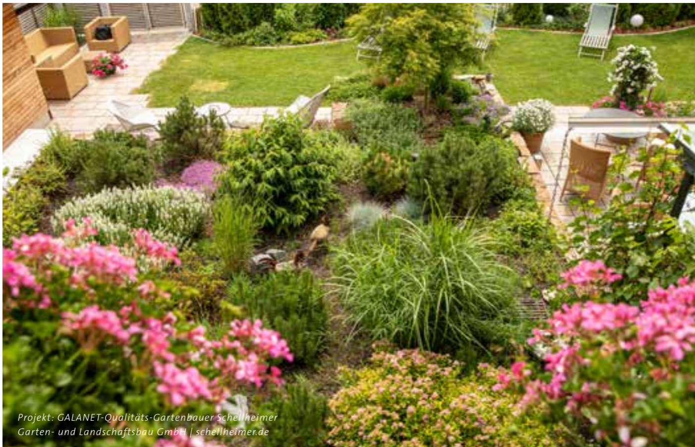
Projekt: GALANET-Qualitäts-Gartenbauer Schellheimer Garten- und Landschaftsbau GmbH | schellheimer.de

https://www.galanet.org/blog/stauden-geschickt-kombinieren/