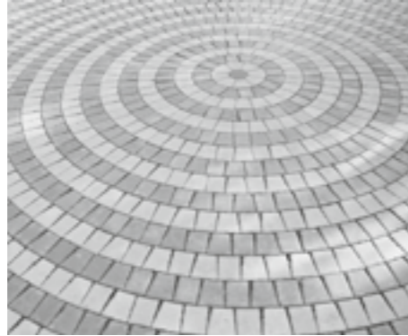
DAS ORGANISATORISCHE NETZWERK Qualität, die der Kunde spürt