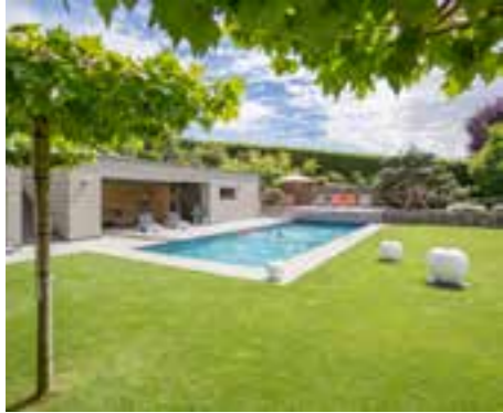
DAS FACHLICHE NETZWERK Qualität, die der Kunde sieht