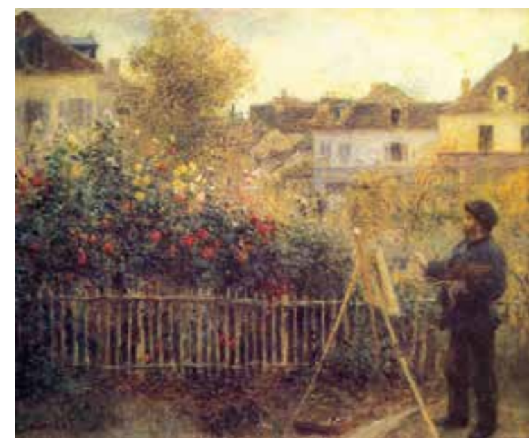
Monet malt in seinem Garten in Argenteuil Auguste Renoir, 1873