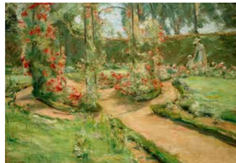
Der Rosengarten in Wannsee mit der Tochter und der Enkelin des Künstlers Max Liebermann, 1928