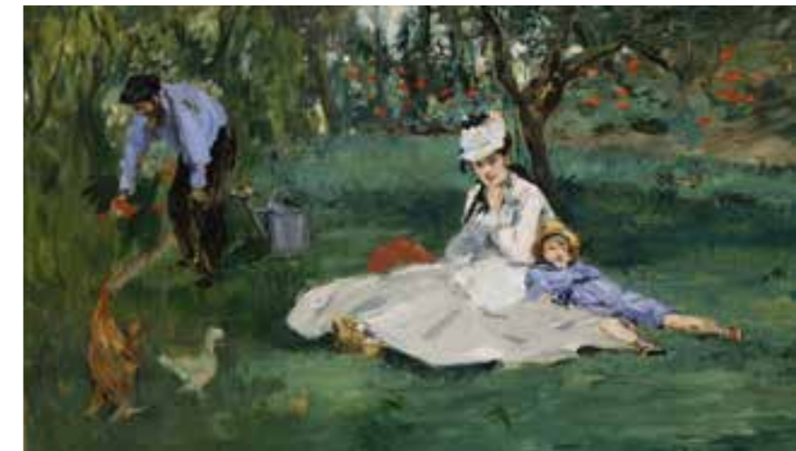
Die Familie Monet in ihrem Garten in Argenteuil Edouard Manet, 1874