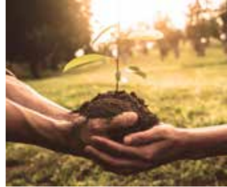
DAS MENSCHLICHE NETZWERK Qualität, die den Kunden begeistert

Liebe Kunden, Sie sind es gewohnt, an dieser Stelle die neuesten Infos aus unserem Verbund zu lesen. Diesmal möchten wir Sie nicht mit News versorgen, sondern unsere Philosophie näherbringen. Vielleicht halten Sie ja sogar Ihre erste INGRÜN-Ausgabe in der Hand?